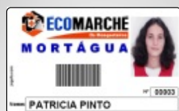
Cartões com código de barras

O TimeReport 64 é um relógio de ponto que, entre outras características, utiliza a mais avançada tecnologia de reconhecimento de impressões digitais de forma a eliminar definitivamente qualquer possibilidade de fraude no controlo de presenças. Independente do sistema que utilize (biométrico, leitura da íris, cartão de aproximação ou cartão com código de barras) o TimeReport 64 é sem dúvida o sistema mais fácil de implementar e de operar, além de ser um dos sistemas mais económicos. Qualquer computador com o Windows 98 (ou superior) pode funcionar com o TimeReport 64. Além disso o sistema pode ser acedido por qualquer terminal de uma Rede de trabalho.