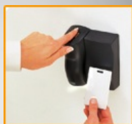
Cartões de aproximação

A utilização (ou não) de ecrã "Touch-Screen", sintetizador de voz, e a sua combinação com um ambiente gráfico simples e atractivo, garante aos seus utilizadores uma percepção intuitiva do que estão a ver e a fazer, sem ter qualquer formação.