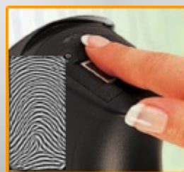
Sistema Biométrico(leitura do dedo)

O TimeReport 64 é um relógio de ponto que, entre outras características, utiliza a mais avançada tecnologia de reconhecimento de impressões digitais de forma a eliminar definitivamente qualquer possibilidade de fraude no controlo de presenças. Independente do sistema que utilize (biométrico, leitura da íris, cartão de aproximação ou cartão com código de barras) o TimeReport 64 é sem dúvida o sistema mais fácil de implementar e de operar, além de ser um dos sistemas mais económicos. Qualquer computador com o Windows 98 (ou superior) pode funcionar com o TimeReport 64. Além disso o sistema pode ser acedido por qualquer terminal de uma Rede de trabalho.